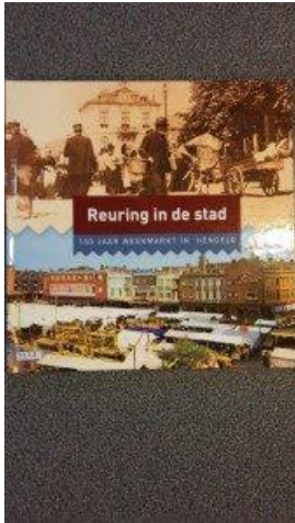
'Reuring in de stad' door Marco Krijnsen

De markt is in Hengelo een instituut. En dat heel lang, want het is dit jaar 150 jaar geleden dat Hengelo verrijkt werd met een 'wekelijkse boter- en groentemarkt'. In die beginjaren werd de markt nog gehouden op ongeveer de plek tussen het stadhuis en de HEMA. Later werd er nog 'gemarkt' aan bijvoorbeeld de Langestraat en de Oldenzaalsestraat, maar tegenwoordig weten Hengeloërs niet anders dan dat de marktkooplui tussen de Beren en de Telgenflat staan.