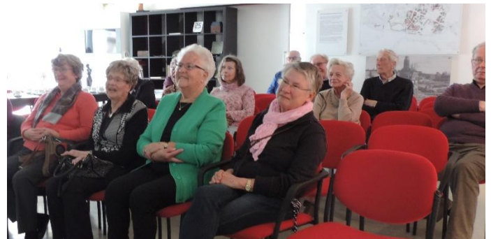
Zowel kleine als grotere groepen kunnen in het nieuwe auditorium terecht.

Wel is de tuinzaal in gebruik genomen als auditorium. Deze is beschikbaar voor lezingen en presentaties. Deze functie wordt volop benut. Het aantal bijeenkomsten is sterk gestegen. Daarmee trekken we nieuwe bezoekers en profileren we ons als kenniscentrum. Als gevolg daarvan overstijgt het aantal deelnemers daaraan zo langzamerhand het aantal museumbezoekers. Deze herinrichting heeft er wel toe geleid, dat we afscheid hebben genomen van de tentoonstellingscommissie.